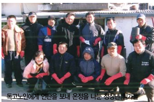
독거노인에게 연탄을 보내 온정을 나누는 청장년 일가들

재춘 청주한씨 청장년회(회장 영수)는 지난 해 12월27일 생활형편이 어려운 독거노인들에게 연탄 2,000장을 보내 사랑의 온정을 나누었다.