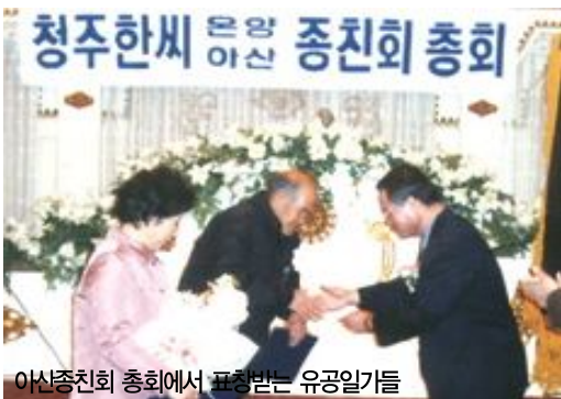
아산종친회 총회에서 표창받는 유공일가들

충남 아산시종친회(회장 德愚)는 지난 2월15일 오전 11시 송악면 소재 전원에식장에서 80여명의 일가들이 참석한 가운데 2006년도 정기총회를 열고 2005년도 세입세출에 관한 강연 감사의 감사보고를 접수한 다음 결산안을 심의, 만장일치로 통과시켰다.