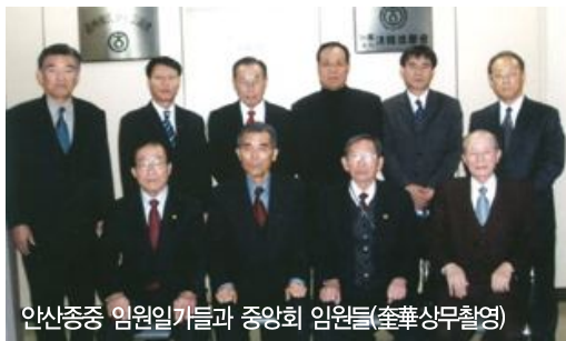
안산종중 임원일기들과 중앙회 임원들

琇洙 회장은 “청한장학회내에 또 하나의 단위장학회를 구성해준데 대해 깊이 감사하며, 새 해 들어 처음으로 거액이 기탁된 감사공파 안산종중의 1억원은 20억 달성 기