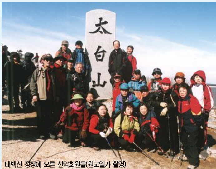
태백산 정상에 오른 산악회원들

2월 산행은 강원도 태백시와 경북 봉화군에 위치한 눈 덮인 태백산으로 정했다. 일행 40명은 26일 새벽 7시 30분 버스로 광화문을 출발, 영동고속도로를 달려 3시간 40분만에 태백산 아래 유일사(柳一寺) 입구 공원관리소 주차장에 도착했다.