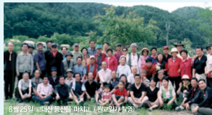
6월 25일 고대산 등산을 마치고...

부 永洙 ▲ 감사 命洙, 錫仁 ▲ 이사 祥敎의 50명, 연락전화 053-257-0452, 회장 주소 대구시 중구 서성로 1가동 73, 총부 주소 대구시 달서구 도원동 1442 별매마을 613동 1003호.