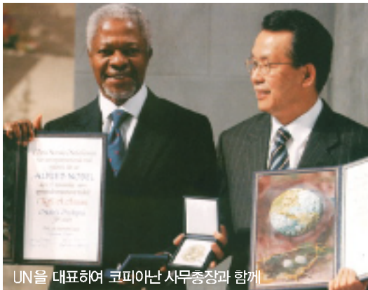
UN을 대표하여 코피아난 사무총장과 함께

중앙총친회 昇洙명예회장이 16년간 정치, 경제, 외교 행정 분야에서 해온 일 가운데 기념될 만한 것을 선정하여 만든 '정책사례집' 「멀티플레이어 경제학자 한승수」가 지난해 말의 1판 1쇄에 이어 1판 2쇄가 지난 4월말 서울대학교 경제학과 출신 학자들을 주축으로 한 제자들에