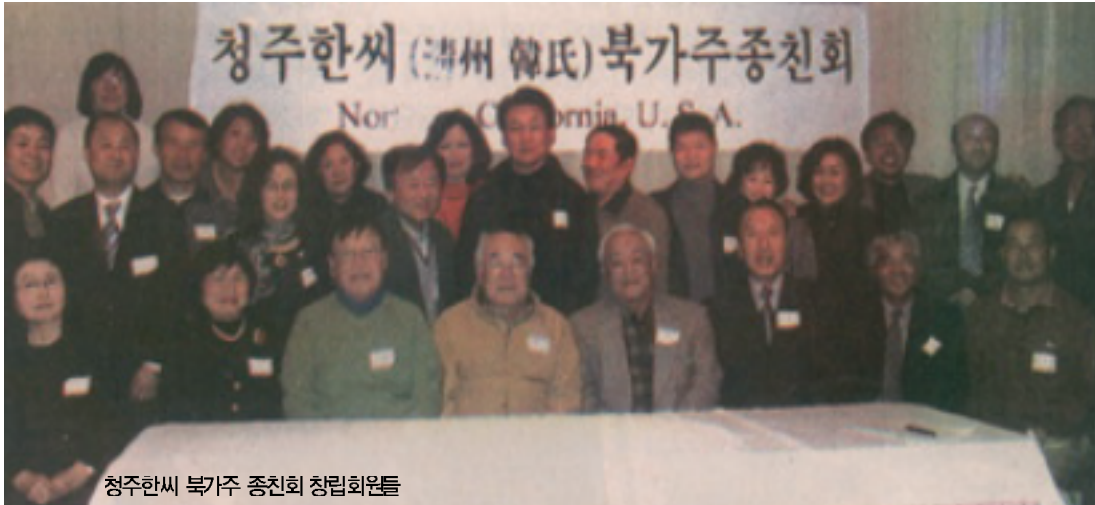
청주한씨 북가주 종친회 창립회원들