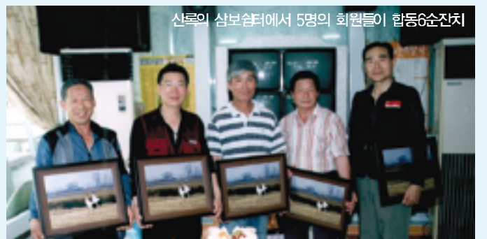
산록의 삼보실에서 5명의 회원들이 합동6순잔치

욱 빛이 나며, 앞으로는 산행하는 달에 생일을 맞는 일가들에게 생일케이크를 증정하는 계획을 세우겠다”고 말했다. 이날의 경비 130여만원은 육순을 맞은 5명의 일가들이 분담했다. (글 星燮부회장)