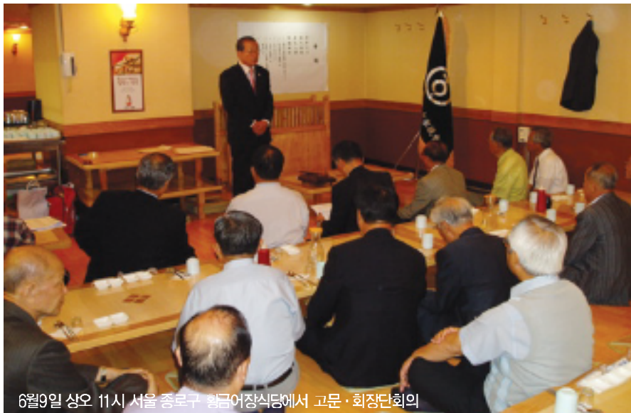
6월9일 상오 11시 서울 종로구 황금어장식당에서 고문·회장단회의

星燮부회장의 사회로 진행된 이날 회의에서 현수회장은 이어 “시조세향일은 원래 음력 10월6일이었으나 지난 1967년 음력 10월 1일로 변경된 것을 보면 절대적인 불변 사안이 아닌 것으로 알고 있다”고 상기시키면서 “총친회 발전이나 시조세향행사의 활성화에 도움이 될 수 있다면 안습(因襲)에 얽매이지 말고 시대 흐름에 맞춰 불합리한 전통이나 관례, 관행 등을 과감하게 개혁, 개선해 가면서 운영되어야 할 것이며, 그렇게 하므로써 우리의 후대에게 총친회의 건전한 조직과 전통을 물려줄 수 있을 것”이라고 강조했다.