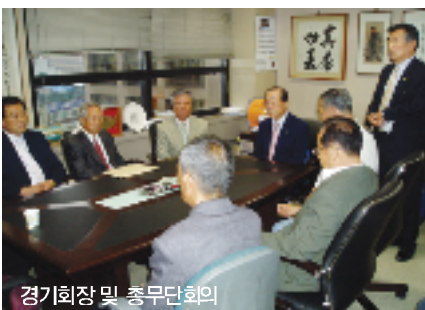
경기회장 및 총무단회의