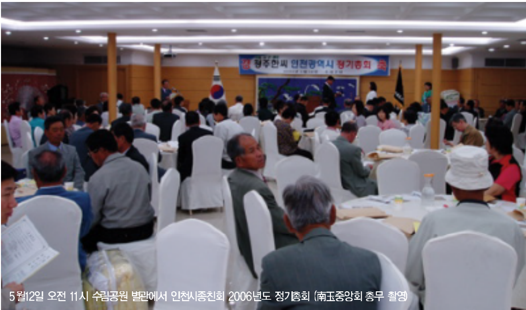
5월12일 오전 11시 수림공원 별관에서 인천시종친회 2006년도 정기총회

인천광역시종친회(회장 寬熙)는 지난 5월12일 오전 11시 수림공원 별관에서 2006년도 정기총회(제37회)를 열고 2005년도 세입세출결산안을 승인하고 2006년도 사업계획 및 2,280만원 규모의 세입세출예산안을 통과시켰다.