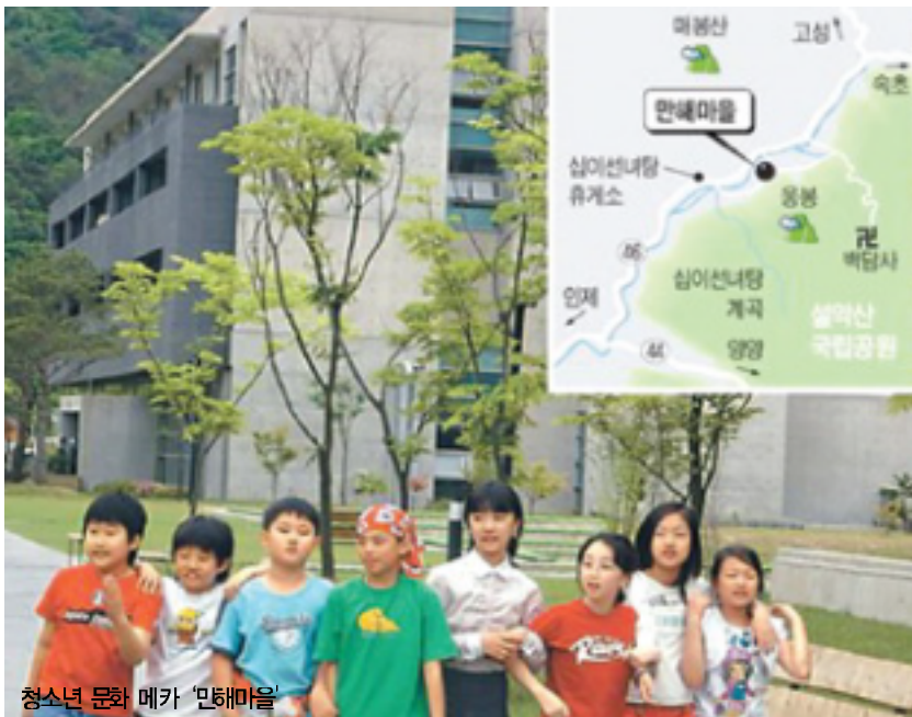
청소년 문화 메카 만해마을

청주한씨 분승을 크게 빛낸 만해(卍海) 韓龍雲(1879~1944)선생의 사상과 업적을 기리기 위해 지난 2003년8월9일 강원도인제군북면용대리 내설악 백담사 입구에 세워진 '만해마을'이 개관 3년을 맞는 올해 들어 방문객의 급증과 함께 청소년들의 수련회 등이 잇달아