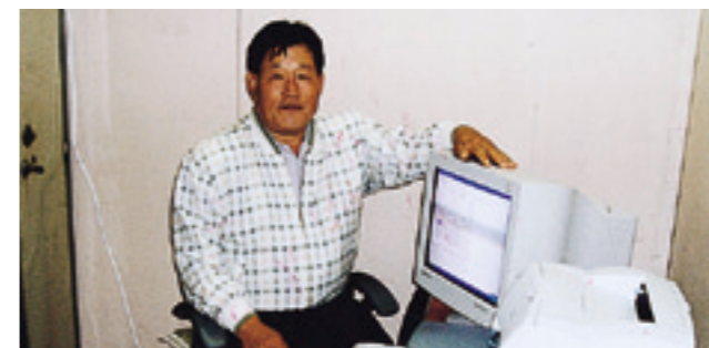
중앙중진회 成龍부회장(문정공하 삼등공파회장, 시조하 29세손)은 지난 4월20일 「7교인터넷한글대동축보」제작용으로 컴퓨터 1대(180만원 상당)를 중앙중진회에 기증했다.