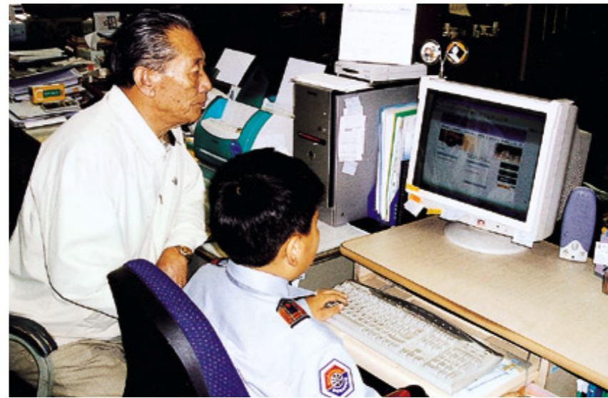
인터넷 한글족보를 열어보는 손자와 할아버지.