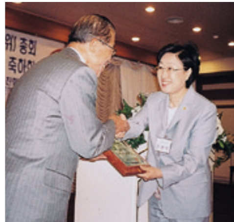
한명숙(韓明淑 · 44년생)고문 *경기 일산갑, 열린우리당, 2선 *한국여성단체연합 상임대표 역임 *여성부장관, 환경부장관

일가가 국회의원에 당선된 것은 가문의 큰 영예"라고 축하하고 "국가와 한문의 명예를 위해 의정활동에서 큰 역할을 해주기 바란다"고 당부했다. 陽命상임고문은 축하에서 和甲고문이 종사사업에 끼친 공로를 각별히 치하하면서 "당선일가들에게 축하를 보낸다"고 말했다.