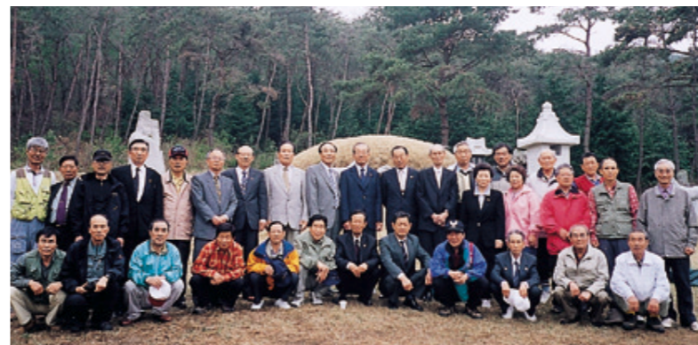
모원재에 참사한 산악회원들.

용문산 아랫동네에서 산채비빔밥에, 회원이 갖고 온 양주를 나누며 친교시간을 갖고 기념촬영 후 귀경. 산행을 안전하게 안내한 萬政일가에게 감사한다.