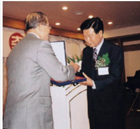
한화갑(韓和甲 · 39년생)고문 *전남 무안·신안, 민주당, 4선 *국민회의 사무총장 역임 *새천년민주당 대표(현)