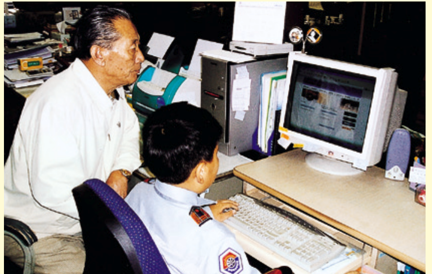
인터넷 한글족보를 열어보는 손자와 할아버지.