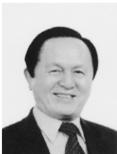
중앙종친회 부 회장

- 43년 전통의 이민, 유학 전문가(주)삼성이주공사가 성실하게 안내해 드리겠습니다.